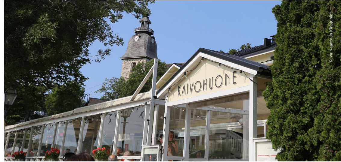
Kuva Naantalin Kirjajuhlat

Muutokset ohjelmaan ovat mahdollisia. Ohjelma päivitetään Naantalin Kirjajuhlien verkkosivuille www.naantalinkirjajuhlat.fi .